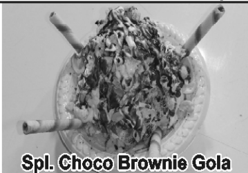
Spl. Choco Brownie Gola